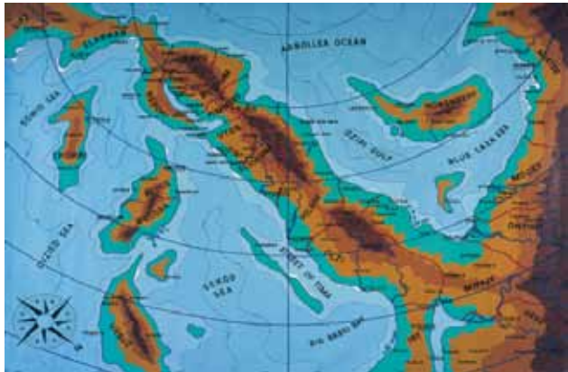
Wim Delvoe, Opoglivic Peninsula , 1992

Les artistes sont des explorateurs. Fascinés, curieux, bon nombre d'entre eux ont réalisé leurs œuvres en rapport à cet espace qui les entoure : le Monde. Un espace vaste, qui peut être géographique, cartographique, politique, voire social. Partons à la découverte de ces artistes qui ont fait de « l'espace monde » un véritable atelier, support et vecteur pour des œuvres contemporaines aux médiums multiples.