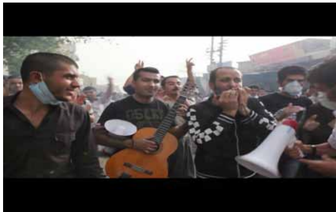
Hiwa K, This Lemon Tastes of Apple , 2011

Manifestation politique et sociale en Irak chez Hiwa K, expédition au Groënland et confrontation au monde chez Laurent Tixador, revendication politique et féministe à Sarajevo chez Maja Bajevic : trois démarches singulières qui questionnent et rendent compte de l'appropriation du monde comme atelier par les artistes de toutes nationalités.