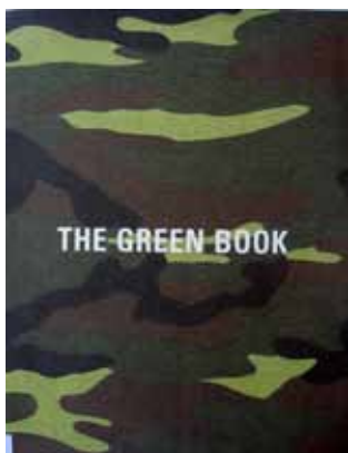
Adel ABDESSEMED, The Green Book , 2002

La thématique « L'œuvre et le monde » résonne dans de nombreux ouvrages qui empruntent les codes de la cartographie, du récit de voyage, inventant ainsi de nouveaux territoires, imaginaires ou réels.