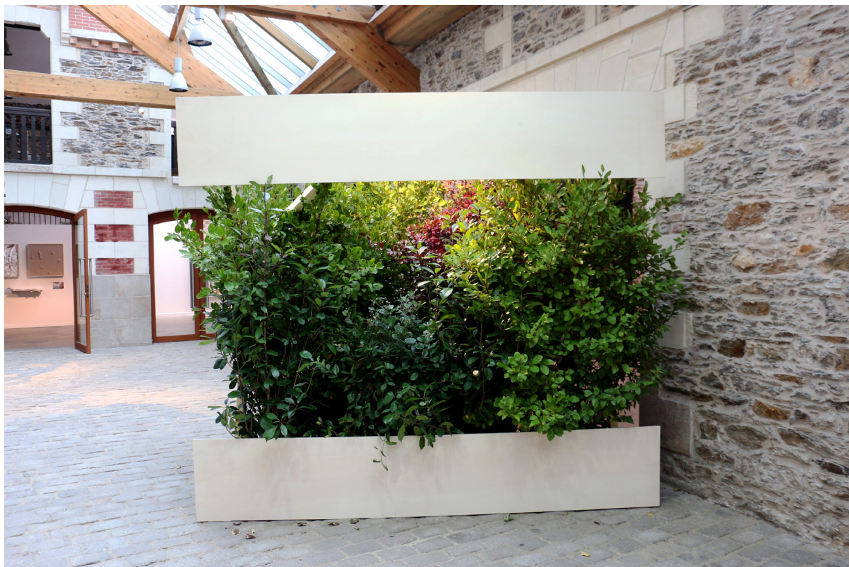
EXPOSITION «LE TEMPS D'Y RÉFLÉCHIR» EXPOSITION COLLECTIVE DES PRIX DE LA VILLE DE NANTES FORÊT SANS-TITRE, 2018. INSTALLATION ; GRISELINE, PHOTINIA, TRACHELOSPERMUM, ACCA SELLOWIANA, DIMENSIONS VARIABLES - L'ATELIER - NANTES.