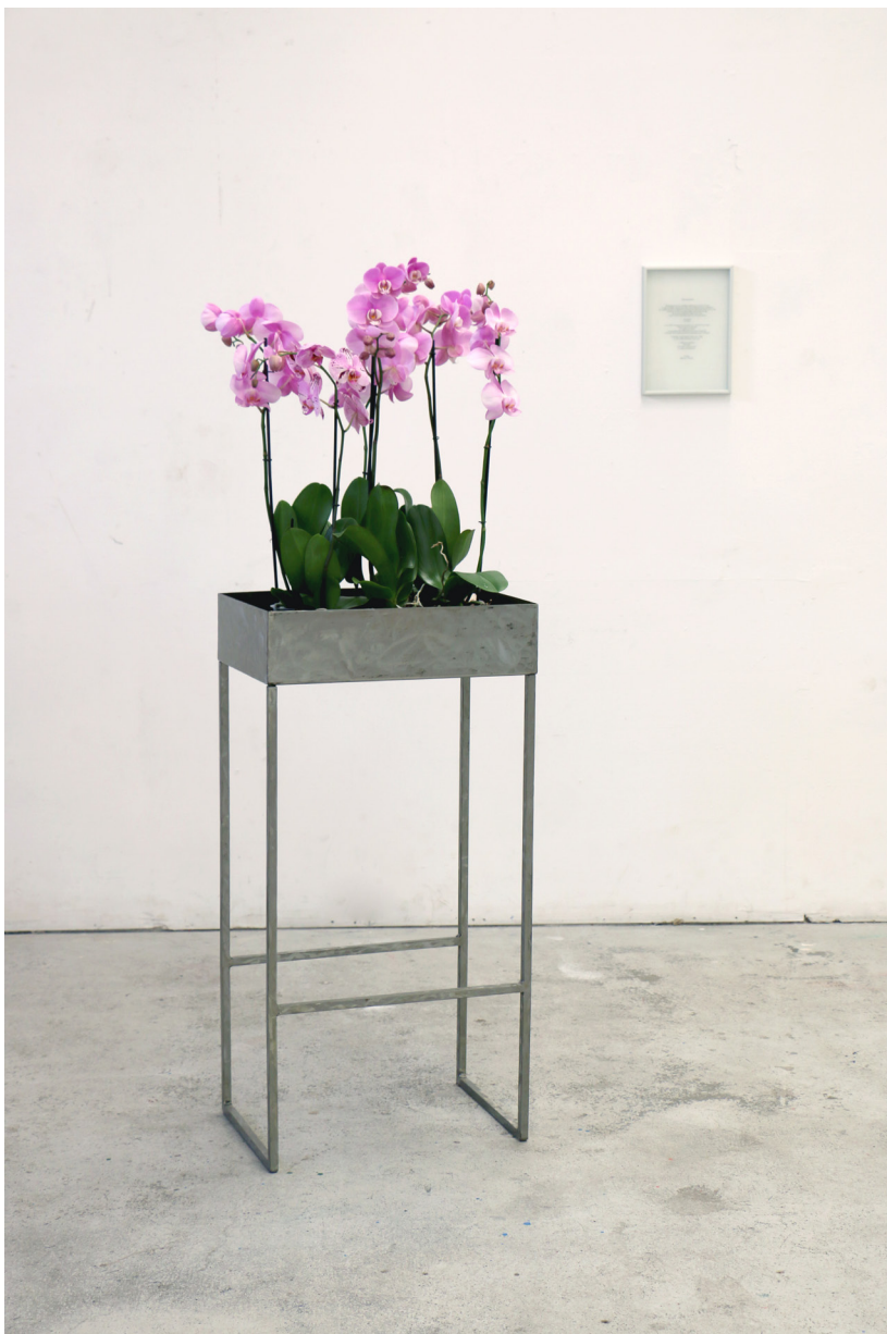
EXPOSITION «À 5 MIN PRÈS À 3 MM D'ÉCART» EXPOSITION COLLECTIVE PETITE RÉSISTANCE #5, 2017. PROTOCOLE PERFORMATIF ; PHALAEOPSIS, ACIER DIMENSIONS VARIABLES - MILLEFEUILLES - NANTES