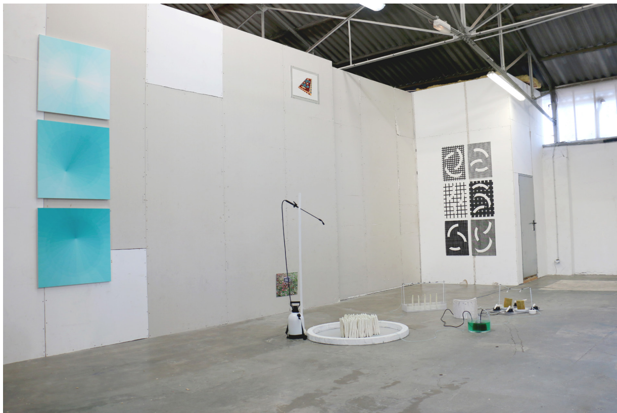
EXPOSITION « À 5 MIN PRÈS À 3 MM D'ÉCART » EXPOSITION COLLECTIVE ASPERGE EN MARGE, 2017. INSTALLATION ; PLÂTRE, BOIS, VERRE, MATÉRIEL ÉLECTRONIQUE, DIMENSIONS VARIABLES - MILLEFEUILLES - NANTES.