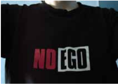
No Ego Project, 2005

Née en 1975 à Dubrovnik. Vit à Dubrovnik et Zagreb.