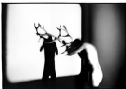
Nature & Society, performance, 2002

Né en 1964 à Dubrovnik où il vit. Slaven Tolj est un des artistes les plus importants de la scène croate. Sa pratique radicale et minimaliste, interroge la société contemporaine en regard de l'Histoire du pays, à travers des performances, photographies et ready-mades. Acteur engagé de la scène de Dubrovnik, il a créé la Fondation d'art Atelier Lazareti en 1988, qui est aujourd'hui l'un des centres d'art les plus actifs en Croatie.