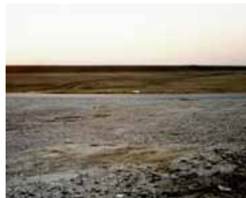
Untitled, #1, 2008