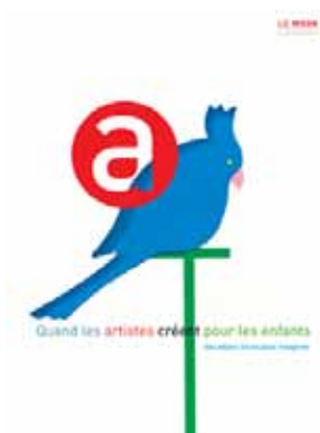
Quand les artistes créent pour les enfants - des objets livres pour imaginer éditions Les 3 ourses / Le Mook

9 de coeur est une revue trimestrielle de création vivante, s'ouvrant aux arts plastiques, à la littérature, à la poésie, à la danse, au cinéma, au théâtre, à la musique... La revue donne à chaque numéro carte blanche à un artiste, propose une BD originale, accueille une nouvelle spécialement écrite pour la publication, et fait le portrait d'un auteur. S'adjoignent des reportages, des entretiens, des jeux et des ateliers. Le tout avec pour trame de fond une thématique renouvelée à chaque numéro.