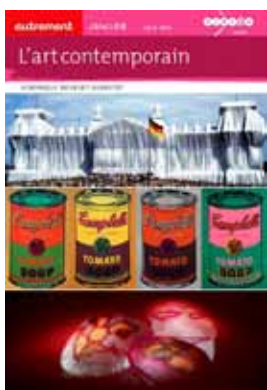
L'art contemporain éditions Autrement