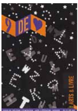
Arts et livres - revue 9 de coeur éditions Le Seuil