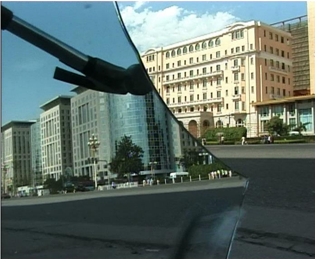
Broken Mirror (Song Dong, 1999)