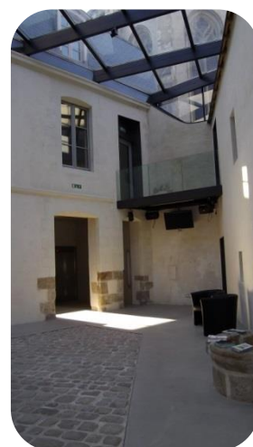
Patio du Passage Sainte-Croix – Nantes

Le Passage Sainte-Croix est un centre culturel qui accueille, expositions, conférences, spectacle vivant et ateliers enfants tout au long de l'année.