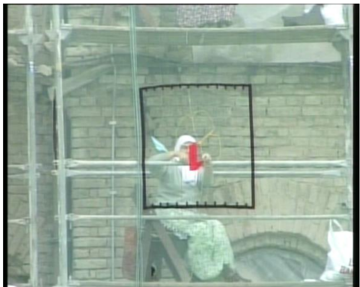
Women at Work – Under Construction (Maja Bajevic, 1999)

Les vidéos présentées dans les différents espaces témoignent de ces recherches artistiques.